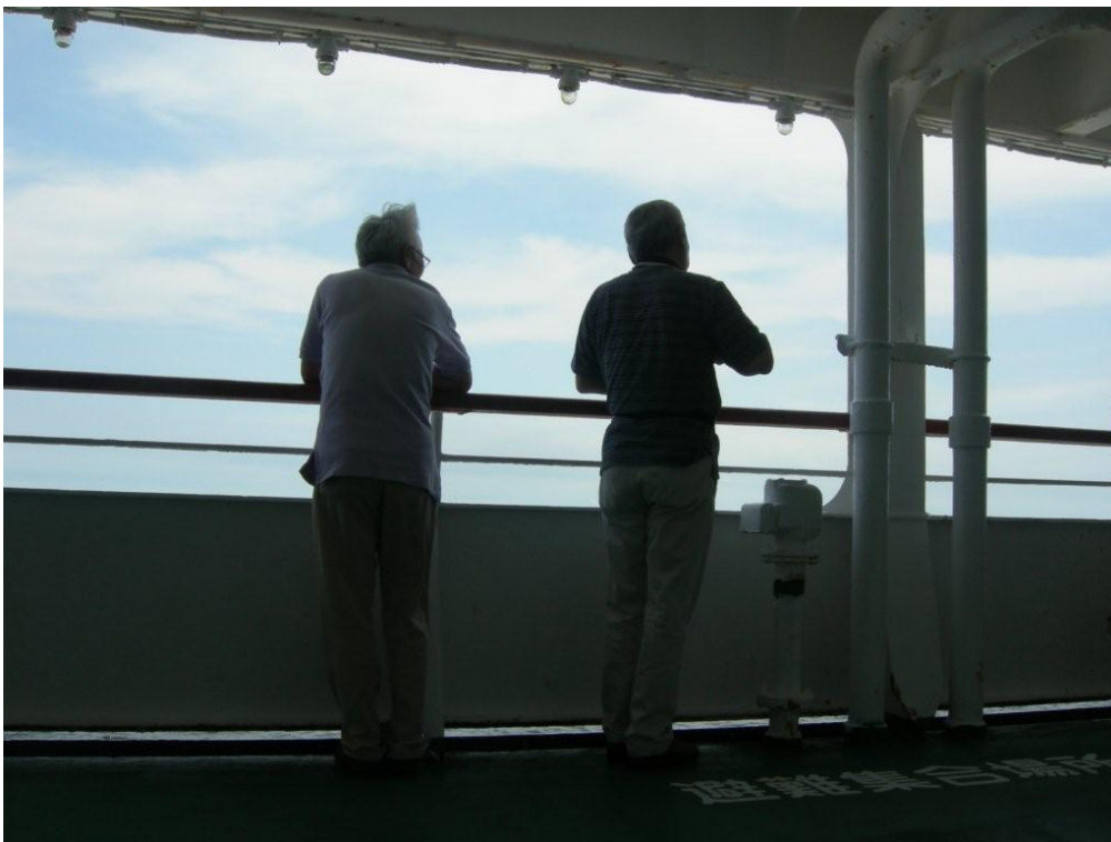
たそがれる二人（おがさわら丸船上にて）

は何よりだった。日食がなければ多分小笠原に来ることはなかったと思うがまあ皆さんも一度はきても良いんじゃないでしょうか。それでは。