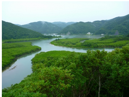
22 日午後雨 マングローブ原生林