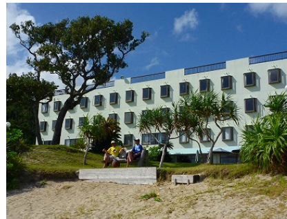
24 日 マリンステーション奄美