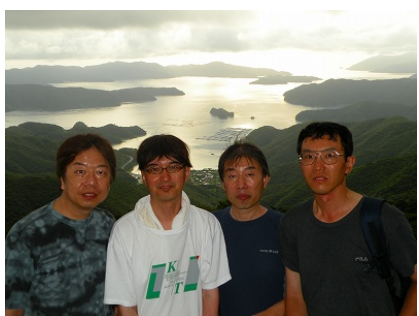
19 日夕陽を背に ↑ 高知山展望台から大島海峡を背に長期組み 4 名で