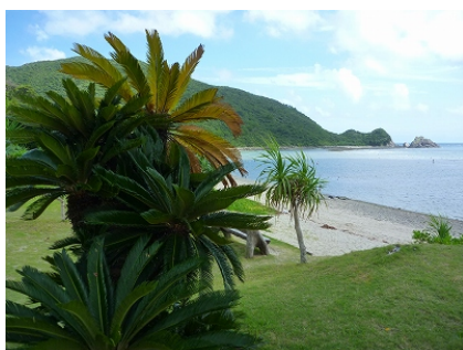
24 日快晴 ヤドリ浜