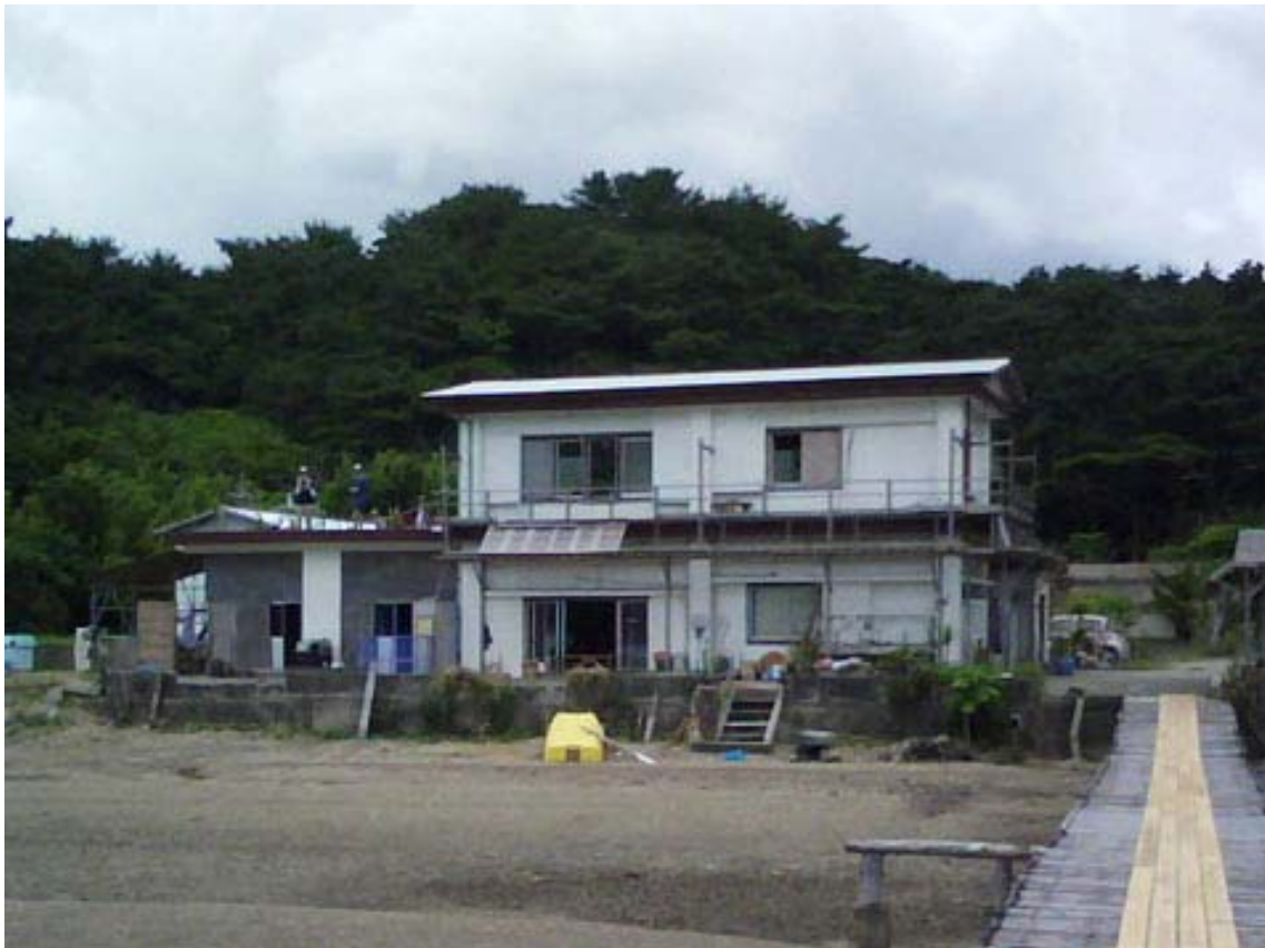
写真④ 奄美大島での滞在、観測拠点となった貸別荘

那覇は、夕方到着、朝出発で滞在時間は短かったが、夜間国際通りへ繰り出し、島唄ライブハウスでカチャーシを踊った事は良い思い出となった。奄美大島で滞在した貸別荘(写真④)は、そのロケーションと居心地が予想以上に素晴らしかった。今回のツアーは、短期間ではあったが、大変満足の行くものであった。