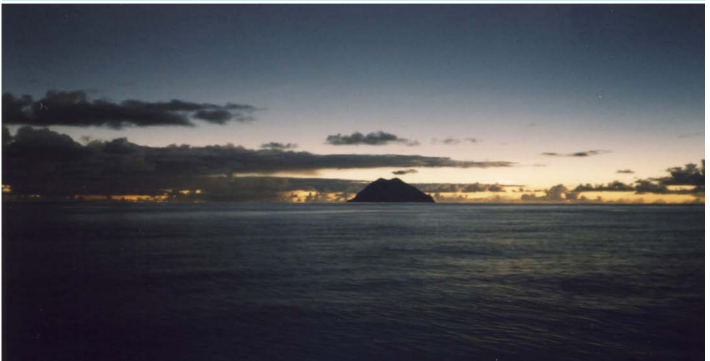
皆既中の北硫黄島

2008年の相模友の会(TUDOB神奈川県民4人の会)の飲み会で、来年2009年7月22日の日食をどうするかということになり、「上海はスモッグでコロナはどうなんだろう、やはり国内のトカラ列島あたりが良いのではないか」という話が出た。種々検討したが、トカラはテント生活のうえ費用も40万円程度と条件がすこぶる悪い。奄美島とか種子島はどうかというと飛行機の予約が難しい。これは無理だろうと、あきらめていたのだが2009年1月に、小笠原海運のおがさわら丸船上日食観測ツアーに応募したところ、幸いにも抽選に当たったので、娘と2人で行くことにした。